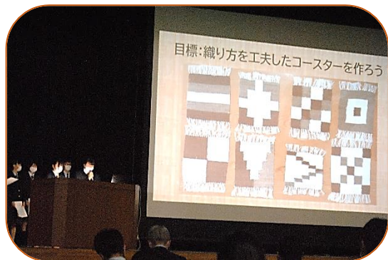
3年次生発表「青谷木綿の活用」