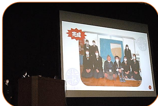
3年次生発表「因州和紙の活用」