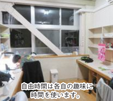
自由時間は各自の趣味に 時間を使います。