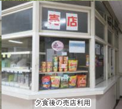
夕食後の売店利用