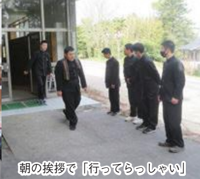
朝の挨拶で「行ってらっしゃい」