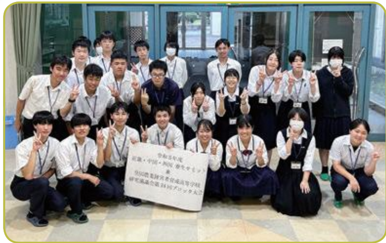
●9月 寮生 サミット