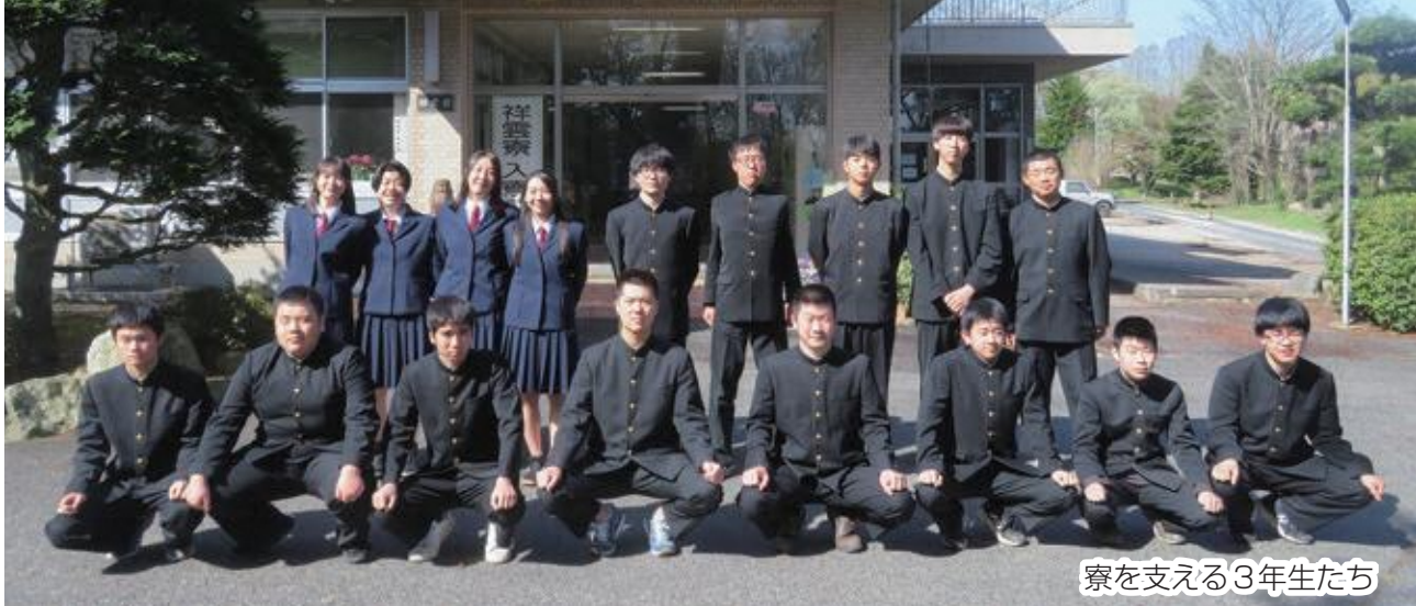
寮を支える3年生たち