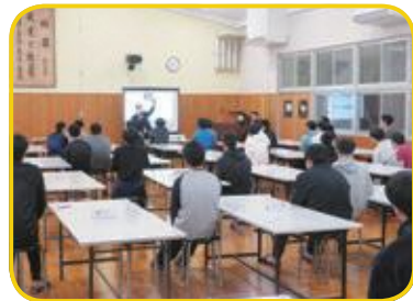
●4月 前期 寮生大会