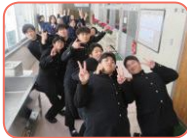
●10月 後期 寮生大会