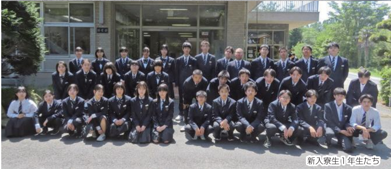
新入寮生1年生たち