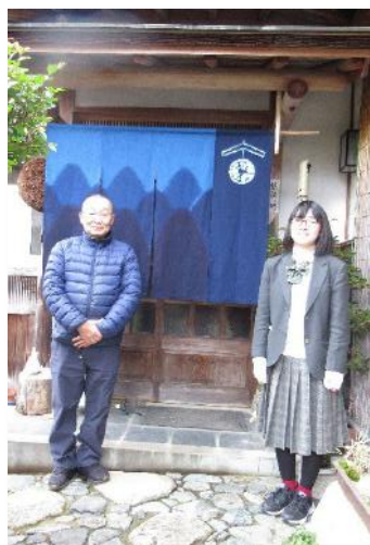
↑ 設置したのれんと一緒に