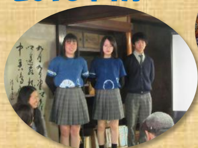
↑ 依頼主への説明会