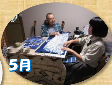
↑ 依頼主との打ち合わせ