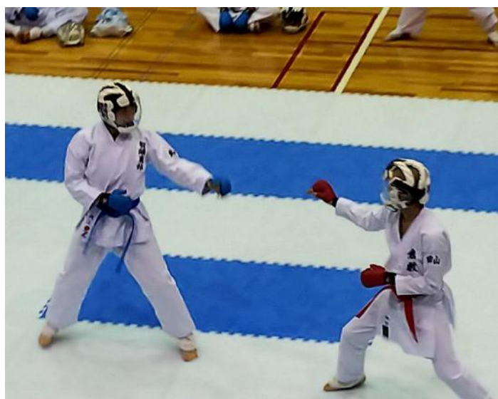
↑ 試合の様子(左が本校生徒)

1月18日(金)に中国高等学校空手道選抜大会が広島県立体育館で行われ、空手同好会に所属する生活環境科1年生の生徒が出場し、岡山代表の相手に大健闘しました。出場した生徒は「この経験を活かして春の大会に向けて練習に励んでいきます！」と決意しています。