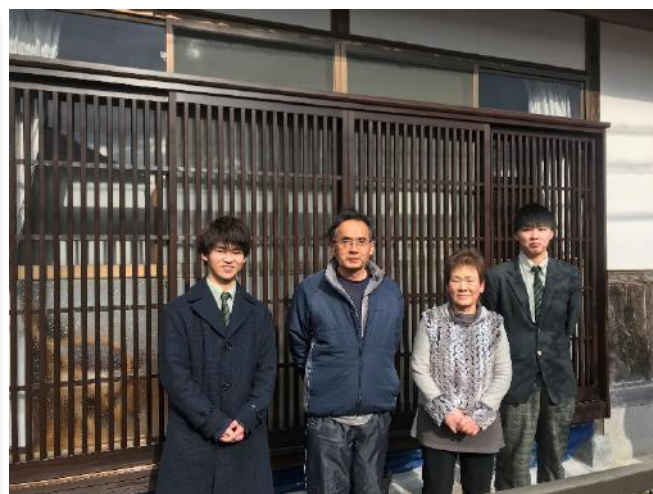
↑ 格子の前でお世話になった方々と記念撮影