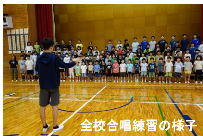
全校合唱練習の様子

学習発表会が近づいてきました。今年は10月10日（金）です。様々な経験をさせることを踏まえ、今年は各学年が劇風のステージを考えています。「劇風」というと少し歯切れの悪い感じですが、劇だけでなく、合奏や歌、音読などを織り交ぜた発表のようで、大道具や小道具が職員室、ワークスペースのあちこちに置いてあります。それらを目にするとどんな内容なのかとても楽しみになります。また、全校合唱では「ビリーブ」を合唱します。先週末には全員で練習を行いました。今年は低音パートを担当する高学年の歌声がよく響いています。練習できるのはあと2週間。子ども達の頑張りを期待しています。