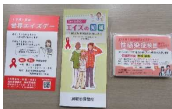
【図書館の展示の様子】