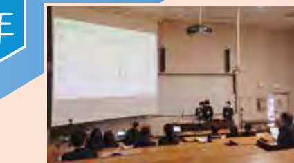
プラズマ・核融合学会 第20回高校生フォーラム 優秀賞