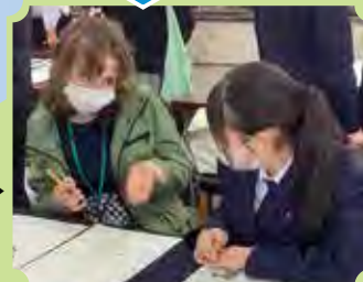
アメリカバーモント州の高校生との交流 (2023)

海外研修や海外との交流を積極的に行っています。2年生の研修旅行は台湾の予定です。