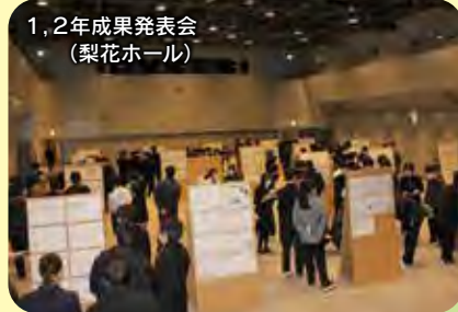
1,2年成果発表会 (梨花ホール)