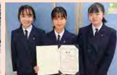
日本地理学会 ポスターセッション 理事長賞