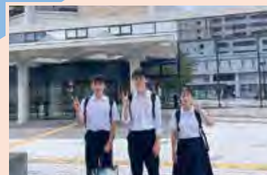
山陰探究サミット