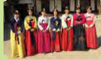
韓国春川高校交流 (2018)