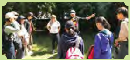
オーストラリアアデレード大学研修 (2019)