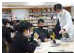
エキスパート教員による授業 (日本史)