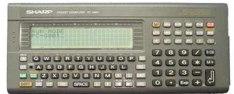
ポケットコンピュータ

以前はパソコンの学習は電子系の学科を中心に行っていました。私が教員になった頃はポケットコンピュータを生徒が個人持ちで購入していました。そのころは月刊誌も発売され、生徒はゲームプログラムを改造しながらプログラミング能力を高めていました。