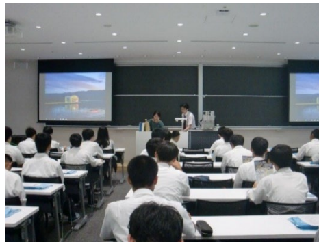
環境エネルギー科