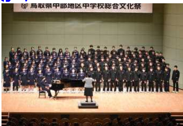
写真は中文祭での3年生の合唱の様子